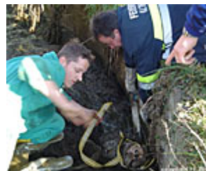
Die FF ALthofen war stundenlang im Einsatz...

Ein Kalb löste am Mittwoch in Althofen (Bezirk St. Veit an der Glan) einen mehrstündigen Feuerwehreinsatz aus. Das Tier war in eine Jauchengrube gefallen und drohte zu ertrinken.