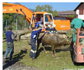
...und schließlich war das Tier befreit - und musste erst einmal abgespritzt werden.

Mit Bagger gerettet. Die Florianijünger sicherten das Tier, damit es nicht mehr ertrinken konnte. Aus der Grube wurde es schließlich mit einem zufällig in der Nähe befindlichen Schaufelbagger geholt. Insgesamt dauerte die Aktion drei Stunden, das Kalb wurde - nach der dringend notwendigen Waschung - unverseht in seinen Stall zurückgebracht.