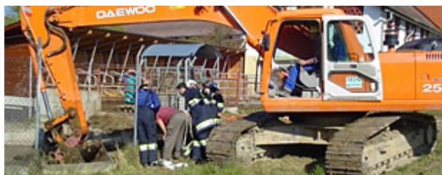
Großeinsatz der FF Althofen, um das Kalb aus der Grube zu holen.