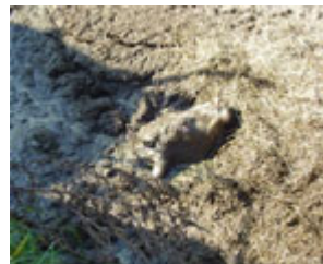
Das Kälbchen drohte in der Jauche zu ertrinken.

Das Tier stürzte Mittwoch in die Grube und drohte zu ertrinken. Mit einem Schaufelbagger wurde es in Sicherheit gebracht.