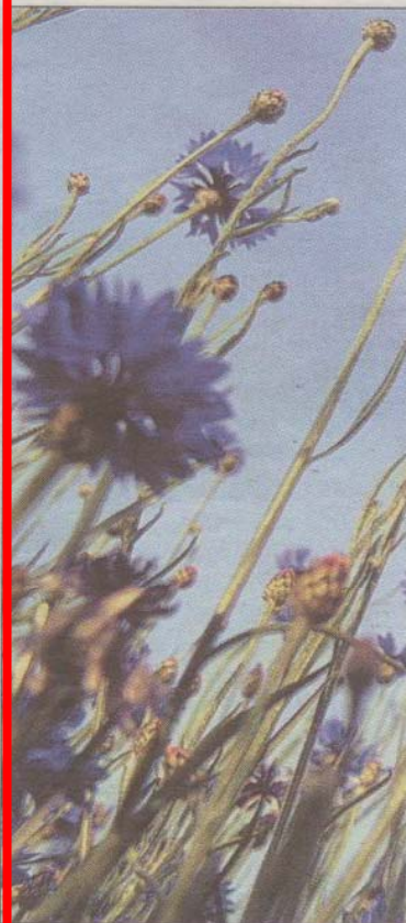
Auf die Feldblumen, die die

Arbeiters (54) aus Michelhofen Feuer. Er brachte die Flammen selbst unter Kontrolle. Großeinsatz für die Feuerwehren St. Veit, Kraig, Obermühlbach und Treffelsdorf: Ein Brand vernichtete in Predl 100 Quadratmeter Wald, konnte aber gelöscht werden. Auch im Lesachtal schlug ein Blitz in einen Baum ein. Ein Kurzschluss löste in einer Fürnitzer Halle der Firma Villas den Brand eines Bitumenbehälters aus. Umweltgefährdung bestand keine. Ausgebrannt ist auch ein Pkw in St. Veit.