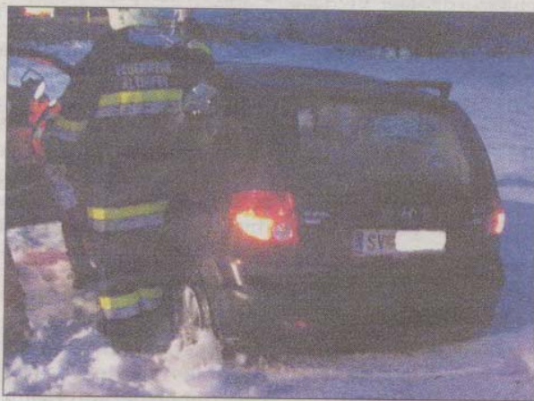
Glück im Unglück hatte die Lenkerin dieses Pkw, der von der Silberegger Landesstraße abgekommen war.