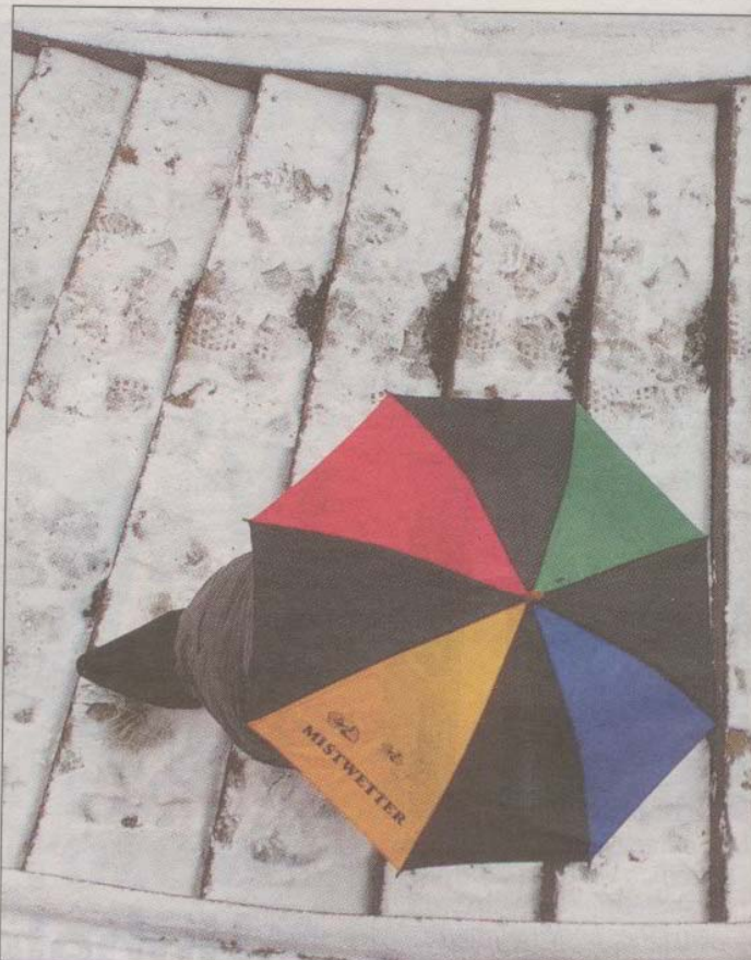
Regen und milde Temperaturen sollten die Schneedecke in den

Während die Gefahr der Dachlawinen auch in den kommenden Tagen nicht unterschätzt werden sollte, bleibt das Risiko in den Bergen relativ gering. „In höheren Lagen sind die Temperaturen immer noch im negativen Bereich und die Schneedecke ist gefestigt“, weiß Wilfried Ertl, Leiter des Kärntner Lawinenwarndienstes.