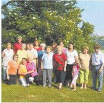
Die St. Veiter Gruppe „fit & aktiv“ feierte vor kurzem ihr alljährliches lustiges Abschlussfest in Gösseling.

LESER-REPORTER. Die Idee für diese Story stammt von unserer Leser-Reporterin Hildegard Hribnik aus Launsdorf. Wir danken herzlichst! Werden auch Sie Leser-Reporter: SMS/MMS: 0699 1 875 875 0 E-Mail: reporter@kleinezeitung.at Internet: www.kleinezeitung.at/reporter