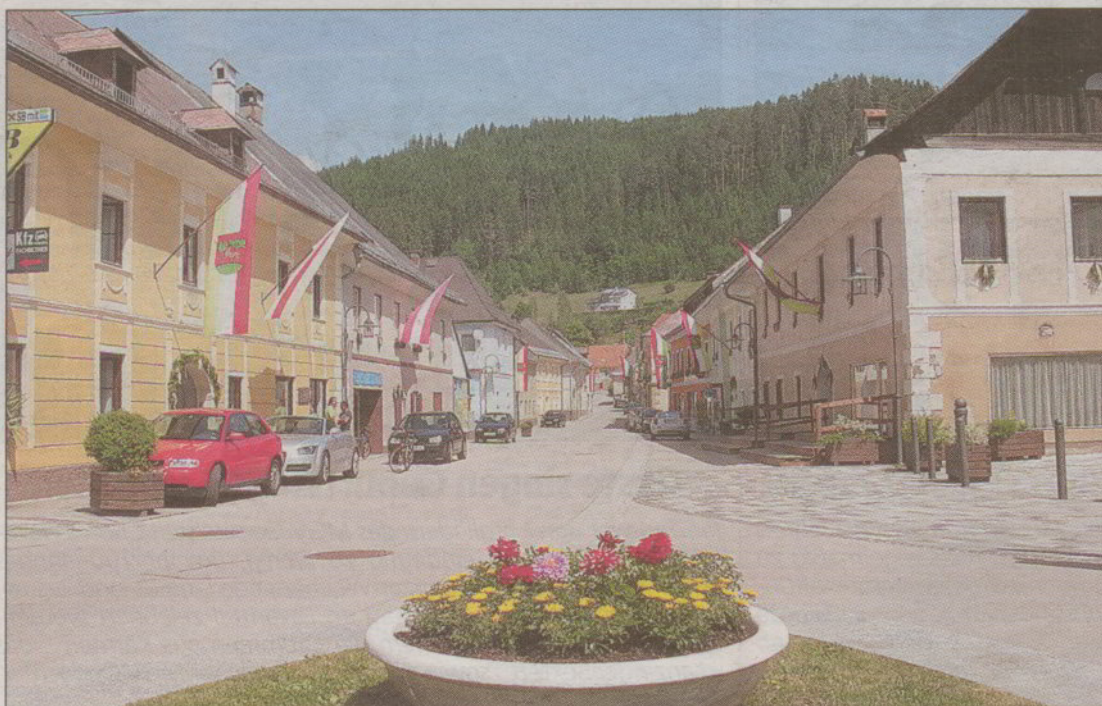
Die Laufstrecke führt an geschmückten Häusern vorbei von der Jungfrau bis zum alten Amt.