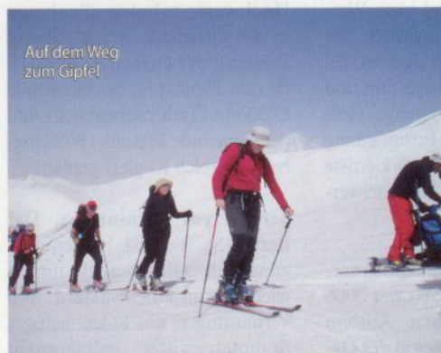
Auf dem Weg zum Gipfel

„Lager 3“, einem kleinen, bunkerartigen Gebäude mit Übernachtungsmöglichkeit und Wasserstelle auf etwa 4.150 m Höhe. Der Gipfel schien schon greifbar nahe, doch aufgrund von starkem Nebel einfall musste die Gruppe samt Führer ca. 500-600m vorm Gipfel umkehren.