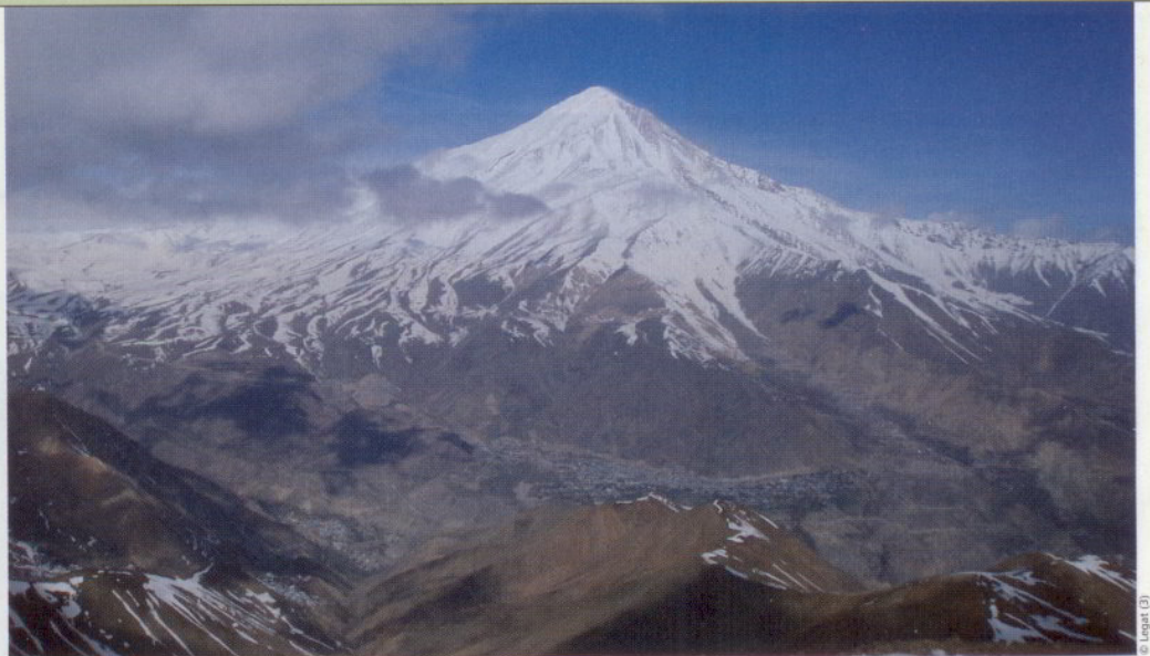
Der Damavand – Irans höchster Berg