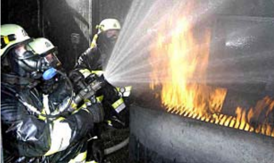
Die Atemschutztrupps der Feuerwehren sind bei Einsätzen immer an vorderster Front

239 Atemschutzträger der Feuerwehren im Bezirk St. Veit wurden auf ihre gesundheitliche und konditionelle Tauglichkeit untersucht. Nur zwei haben Test nicht bestanden.