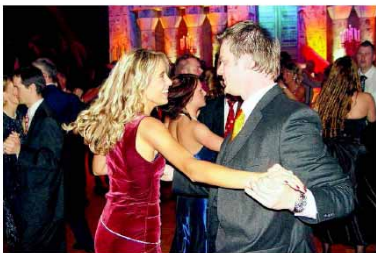
Beim Feuerwehrball in Althofen kommen natürlich die Tänzer nicht zu kurz: Zur musikalischen Unterhaltung spielen Die Wörtherseer

Die Theatergruppe Guggehandsch lädt am Samstag, dem 9. Februar, 20 Uhr, in den Kultursaal Sirnitz