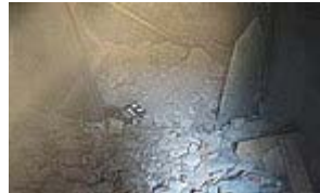
► Deckeneinsturz in Wohnhaus