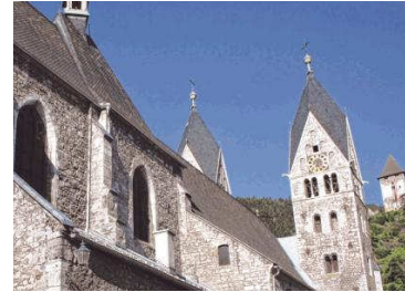
Auch im Dekanat Friesach verzeichnete man im Vorjahr weniger Austritte