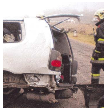
Ein Einsatz betraf auch den Verkehrsunfall auf der Friesacher Bundesstraße