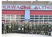
Die Teilnehmer der Maschinistenausbildung des Bezirkes St. Veit/ Glan

In einem Statement stellte der Ausbildungsleiter des Kärntner Landesfeuerwehrverbandes, BR Ing. Klaus Tschabuschnig, fest: „Der große Erfolg dieser Veranstaltung ist auf eine optimale Vorbereitung des KLFV und des Ausbilder-Teams des Bezirkes St. Veit zurückzuführen und ist jedenfalls richtungweisend für die folgenden Lehrveranstaltungen in den weiteren Bezirken ab Herbst 2013.“