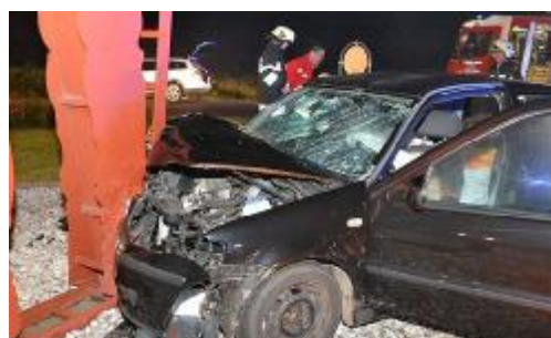
Auto prallt ungebremst in Stahlskulptur

In der Nacht auf Montag übersah ein 76-jähriger Pensionist aus Treibach mit seinem Auto auf der Krappfeldstraße im Gemeindegebiet von Passering einen Kreisverkehr. Er prallte ungebremst in eine Stahlskulptur in der Mitte des Kreisverkehrs.