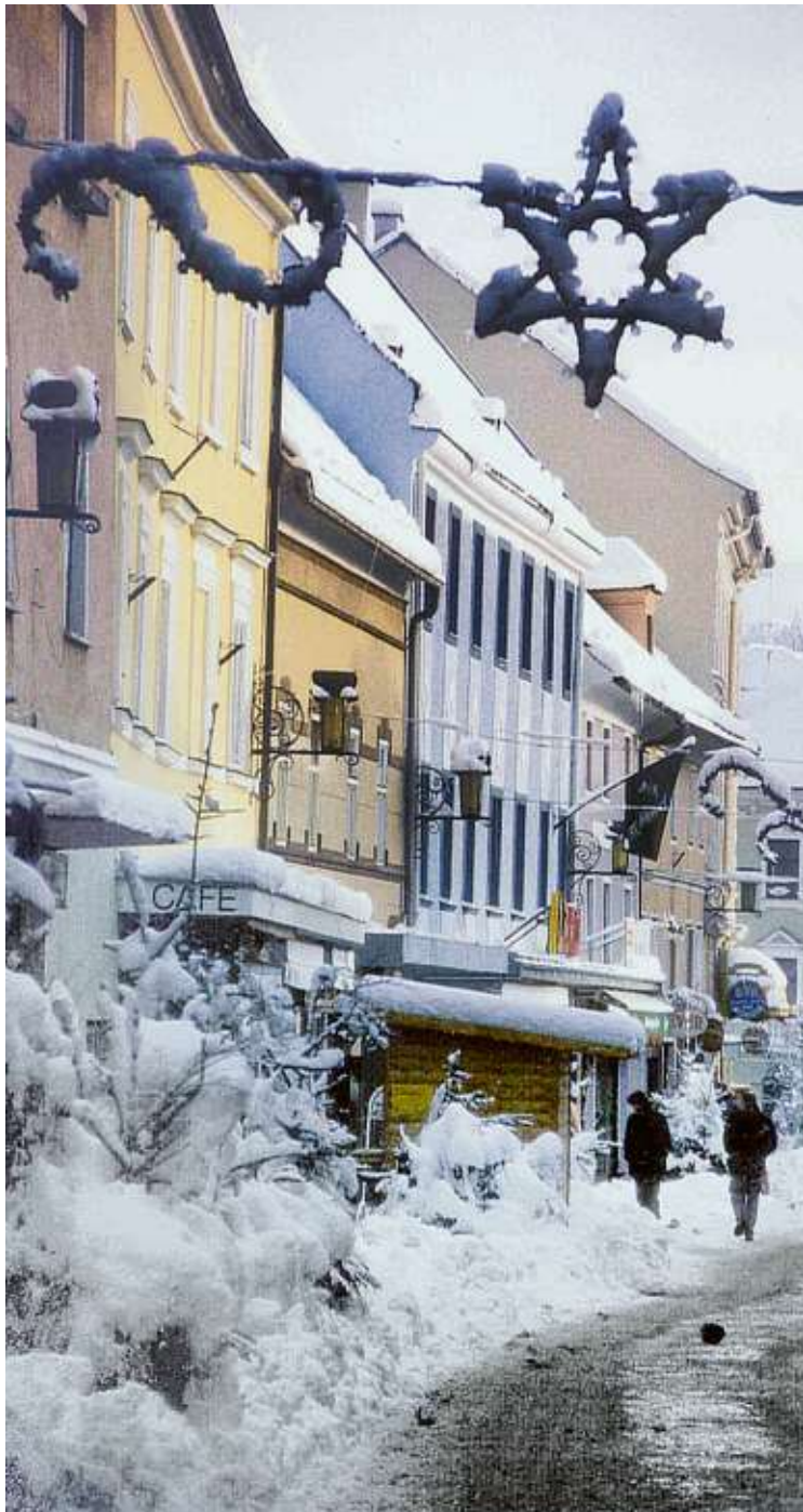
Einstige Winterstimmung am St. Veiter Herzog-Bernhard-Platz WADL (3)

Eine bizarre Winterlandschaft, die von viel Schnee und gleichzeitig klirrender Kälte zeugt, aufgenommen an der Glan. In welchem Jahr, das ist leider unbekannt