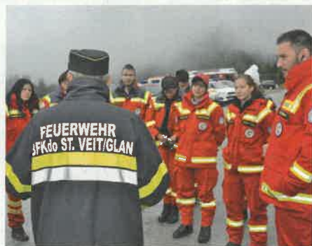
Auch Hundeführer waren mit dabei

Erschwerte Verhältnisse. Die Löscharbeiten des Waldbrandes erweisen sich als schwierig. Die Einsatzkräfte und geländegängige Feuerwehrfahrzeuge werden aufgestockt. Beim Flattnitzbach werden zwei Saugstellen errichtet. Eine Lageerkundung ergibt, dass 10 Hektar Waldfläche in Brand stehen und 50 Hektar gefährdet sind. 200 Haushalte sind ohne