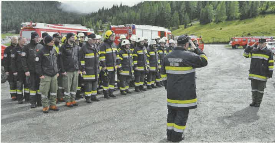
Die Blaulichorganisationen sind bei jedem Wetter im Einsatz