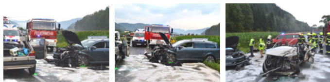
Im Kreuzungsbereich der Metnitztal Straße (L 62) und der Friesacher Straße (B 317) kam es bei einem Abbiegemanöver zu einem Frontalzusammenstoß zweier PKW