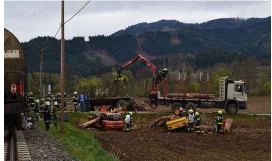
Drittes Übungsszenario: Zugunglück mit mehreren verletzten Personen

Nachdem die Suchaktion erfolgreich beendet wurde, heulten erneut die Sirenen. Das Übungsszenario: Blitzschlag löste einen Waldbrand auf dem Petersberg aus.