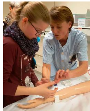
Schüler bekommen auch Einblicke in medizinische Berufe BBOK (2)

unterschiedliche Berufe zu informieren und diese auch auszuprobieren: in der Metall- und Elektrotechnik, im Bau- und Baunebengewerbe, im Handel, im IT-Bereich, in Dienstleistungs-, Tourismus- und Pflegeberufen. Bei der direkten Begegnung mit der Arbeitswelt in den Betrieben können die